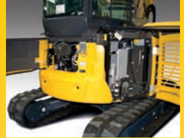
Achterkleppen voor een snelle motorcontrole, gemakkelijke controle en reiniging van de radiateurs en een snelle toegang tot de accu

Hydraulische ORFS koppelingen en elektrische DT connectoren maken de machine betrouwbaarder en zorgen ervoor dat herstellingen sneller en makkelijker verlopen. Dankzij duurzame lagerbussen en het feit dat de olie van de machine slechts om de 500 uur moet worden ververs, worden de bedrijfskosten verder vermindert.