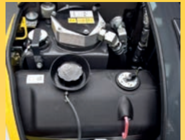
Handig en veilig brandstof en olie vullen onder de voorste motorkap