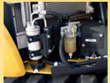
Een groot brandstoffilter en brandstofvoorfilter met waterafscheider beschermen de motor