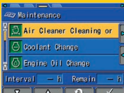
Op het multifunctionele monitorscherm krijgt de machinist onderhouds- en service-informatie te zien