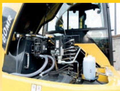
Verbeterde toegang voor onderhoud