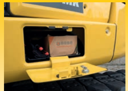
Royale opbergruimte onder de cabine