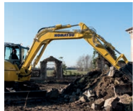
Slangbreukbeveiliging op hef- en armcilinders