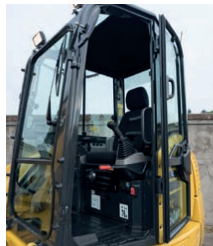
Nieuwe scharnierende deur voor vlottere toegankelijkheid