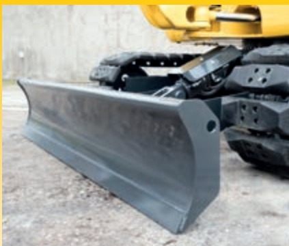
Nieuw, verbeterd ontwerp van het dozerblad