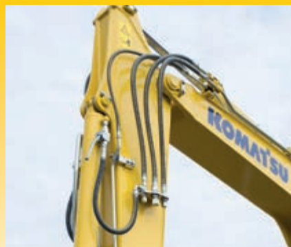
Standaard enkel- of dubbelwerkende hydraulische functie voor uitrustingsstukken en hydraulische snelwisselfunctie