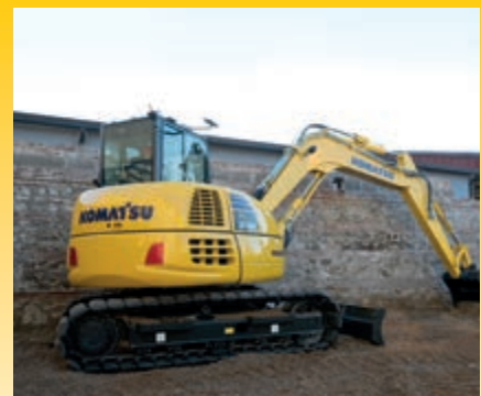
Door een kleinere zwenkradius voor en een zwenkfunctie voor de giek is het graven van sleuven een makkie